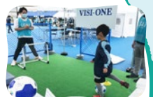
NEW LIFE! Wheel AIROBOTS